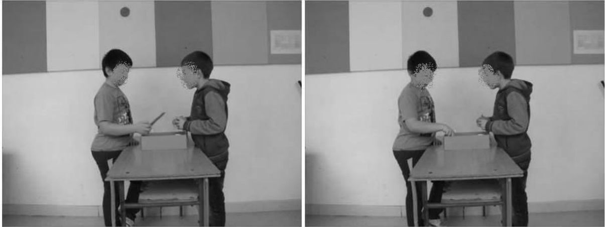
5. jelenet. Tárgy felmutatása (javaslat) és a fej oldalra billentése (beleegyezés)