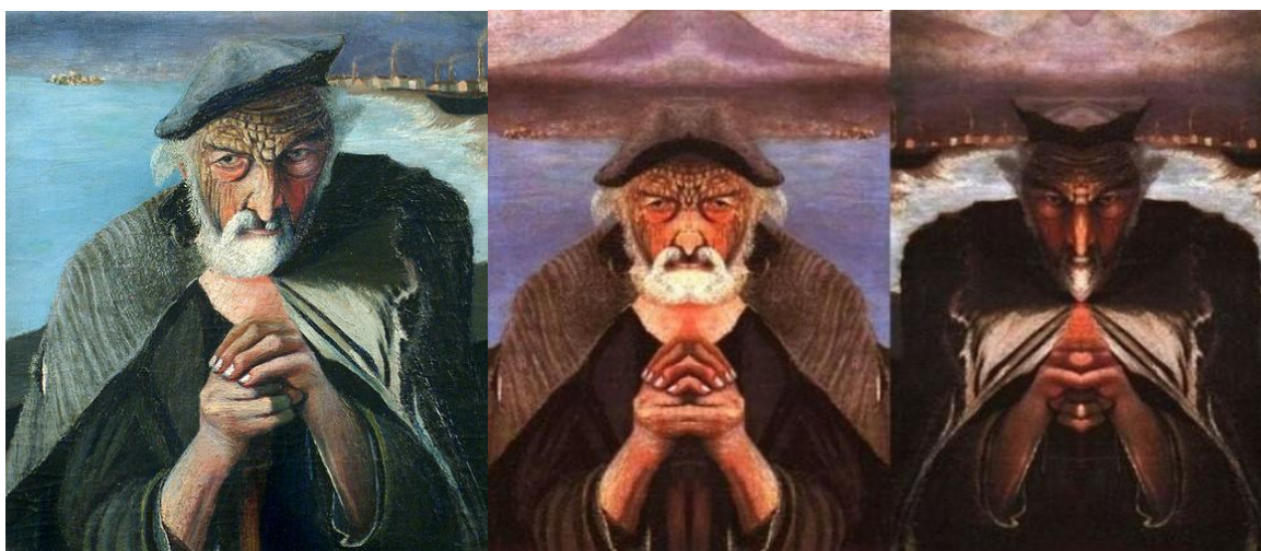
2. ábra. Csontváry Kosztka Tivadar „Öreg halász” című festménye (balra, 1902 körül). 6 A középső és a jobboldali kép az eredeti festmény hossz tengelye mentén való tükrözésének eredménye. 7 E két kép azt illusztrálja, hogy egy fogalmi keret bizonyos elemeinek kiemelése és mások elrejtése (lásd pl. Kövecses & Benczes 2010: 224, 227) akár szélsőséges módon is képes eltorzítani egy üzenetet.

zetességeknek eleget tesz: a háttér nagy kiterjedését az összes konzervatívnak tekintett elmélet összevonásával éri el. AZ ELMÉLETEK TÁRGYAK metafora alapján a sok hagyományos elmélet összességét egy nagy kiterjedésű, statikus tárgyként képzeljük el. Ehhez képest találkozunk a könyvben a naturalizált elmélet leírásával, amelyet egy kis kiterjedésű, dinamikus tárgyként perceptualizálunk. Ennek az írói stratégiának egyik lényegi része az, hogy az ERŐDINAMIKA képi sémát szinte kizárólag a naturalizált modell leírásában találjuk meg.