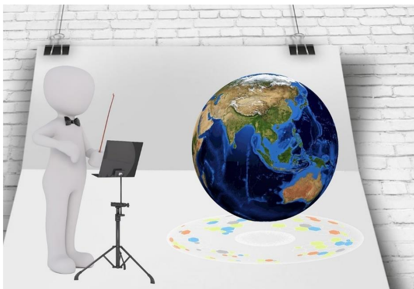
1. ábra. A MENEDZSER A KARMESTER metafora vizuális megjelenítése